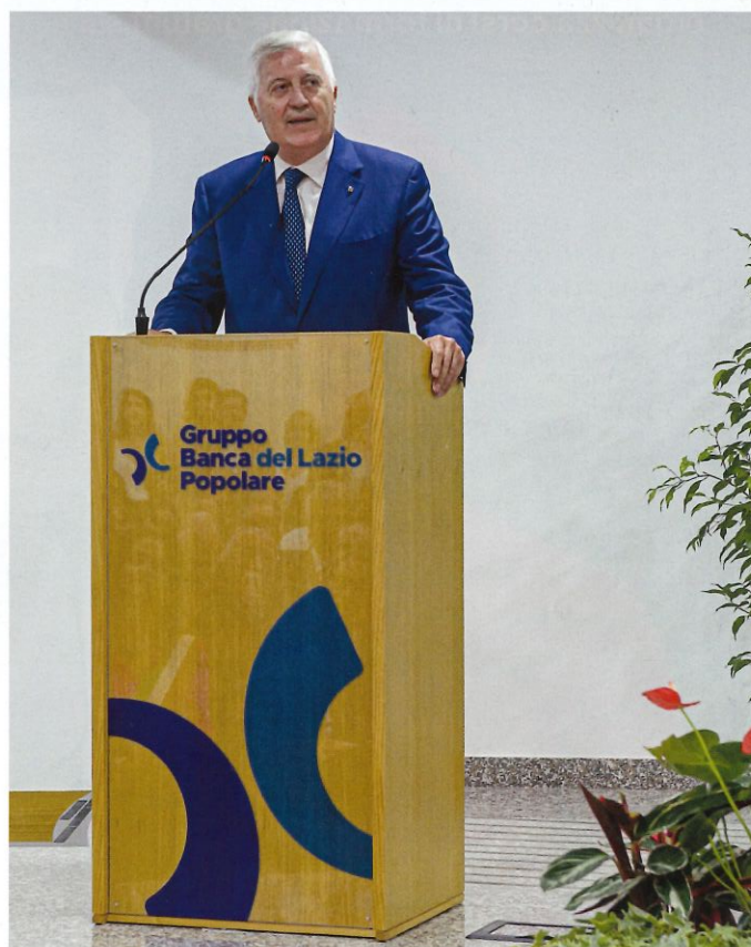
MASSIMO LUCIDI PRESIDENTE DEL COMITATO ESECUTIVO DI BANCA POPOLARE DEL LAZIO

Nel 2021 la Banca Popolare del Lazio attraverso la cessione di 52 filiali ha creato Blu Banca diventando gruppo bancario. La creazione di una società per azioni, Blu Banca , ha la finalità di attrarre investitori e creare il percorso ideale che consenta nel medio periodo anche un'ampia liquidità del titolo azionario con la quotazione nei mercati. La Mission cooperativa ed il legame con il territorio rimane l'orientamento strategico, in quanto le quote azionarie di Blu Banca sono possedute